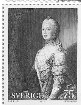
Gustav III och drottning Sofia Magdalena